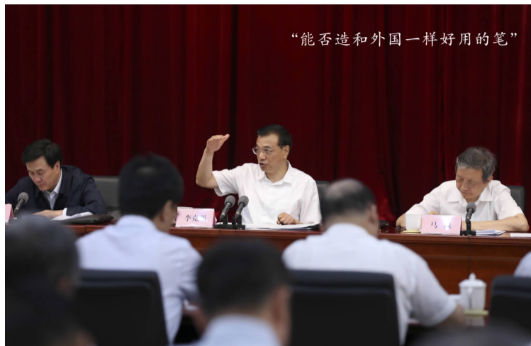
“能否造和外国一样好用的笔”